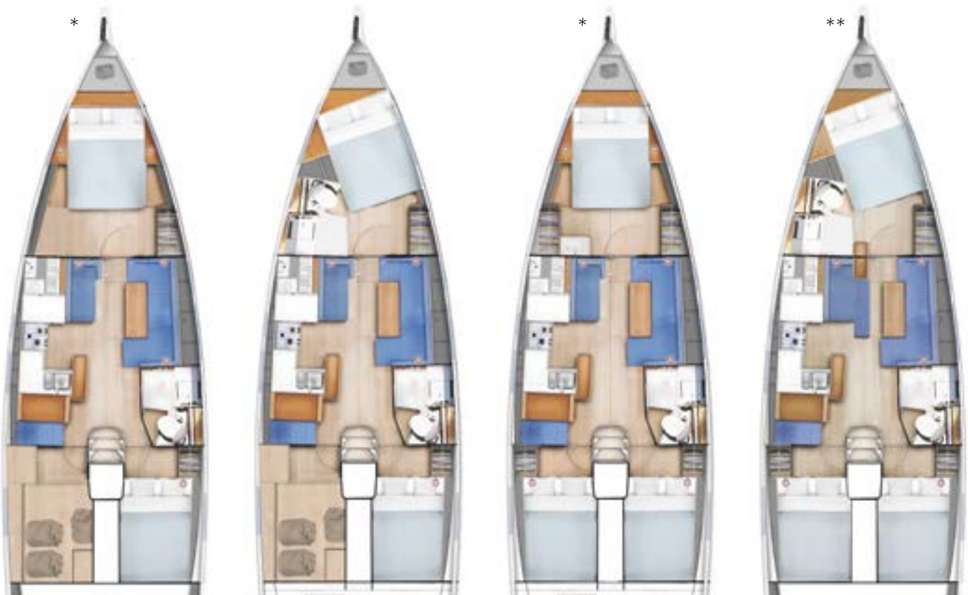
* Optional dressing and furniture with private sink to portside (in forward cabin) / Dressing et meuble avec lavabo privatif à bâbord (dans la cabine avant) en option. ** Swing keel version / Version quille relevable