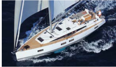
Jeanneau Yachts Luxury and ocean sailing Luxe et grande croisière