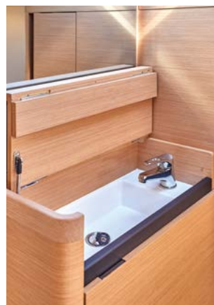
◀ Private sink (optional) Meuble vasque privatif (option) Privates Waschbecken (option) Mobiletto privato (opzionale) Mueble de aseo privado (opcional)