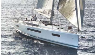
Sun Odyssey Elegance and performance Élégance et performance

Discover all these and more at www.jeanneau.com , or at your local Jeanneau Dealership.