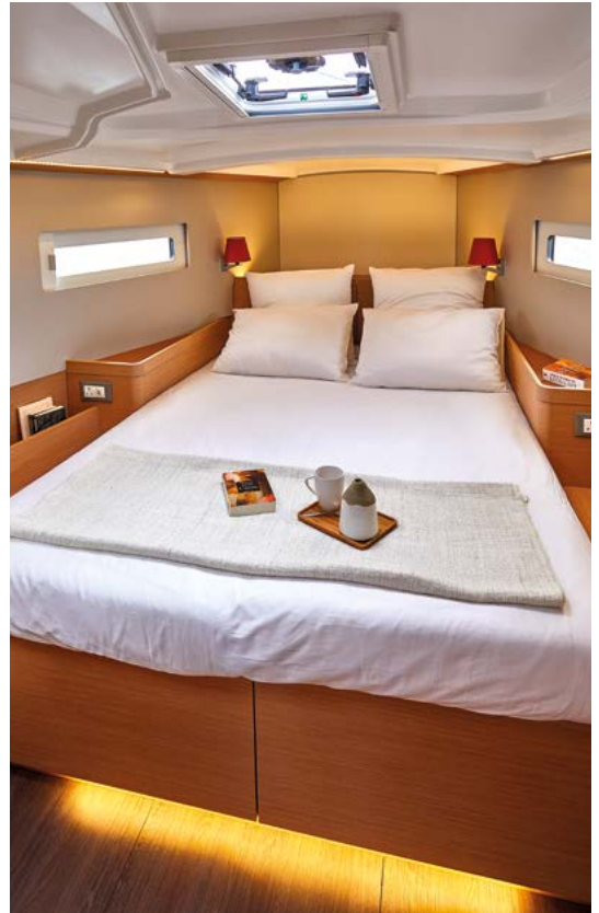
▲ High standard master cabin Cabine propriétaire de haut standing Eignerkabine mit hohem Standard Cabina propietario de alta gama Lussuosa cabina armatoriale