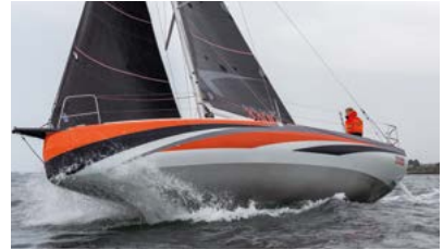
Sun Fast Race short-handed or with crew Course en solitaire comme en équipage